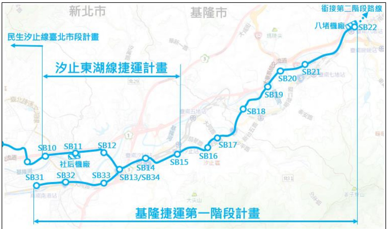
圖 1 基隆捷運第一階段計畫場站位置示意圖

基隆捷運第一階段路線由 SB22 站起，向西以高架沿明德一路、工建西路、實踐路，跨越基隆河進入五堵基隆科技園區，續轉至新北市大同路三段、新台五路二段，銜接汐東捷運共軌段之 SB15 站，至 SB13 站前方路線分開再轉入臺鐵第三軌用地，後續以地下潛盾隧道方式行經南港路至終點 SB31 站。全長 15.6km(含與汐東捷運共線段 2.2km)，沿線共 13 座車站(地下:3；平面:1；高架:9(含 2 座與汐東捷運共站))。