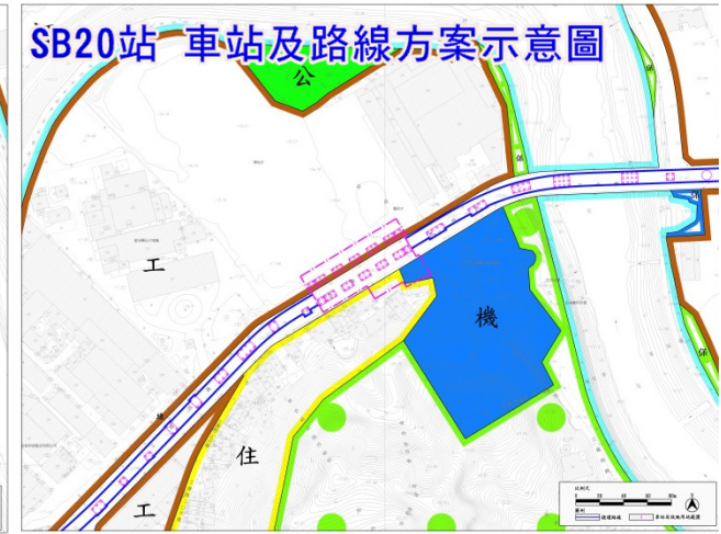
相關書圖僅供參考，實際內容以都市計畫核定內容為準