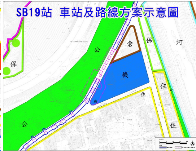
相關書圖僅供參考，實際內容以都市計畫核定內容為準