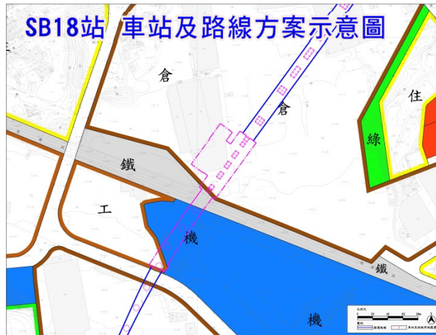
相關書圖僅供參考，實際內容以都市計畫核定內容為準