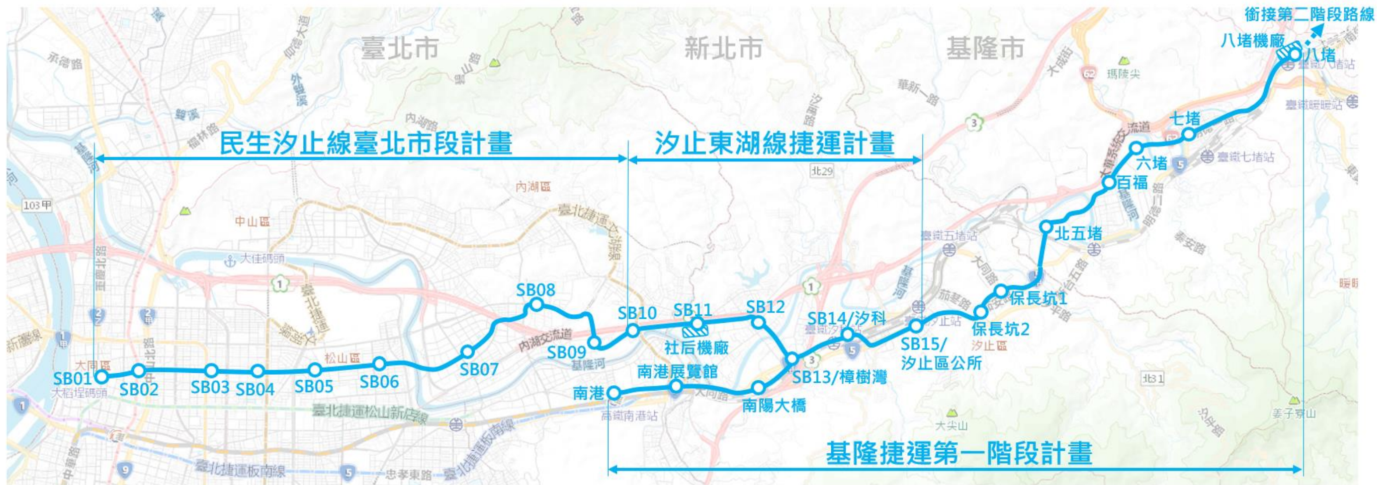
捷運民生汐止線臺北市段、汐東線及基隆捷運路線方案示意圖 (尚未定案僅供參考) 113年1月版