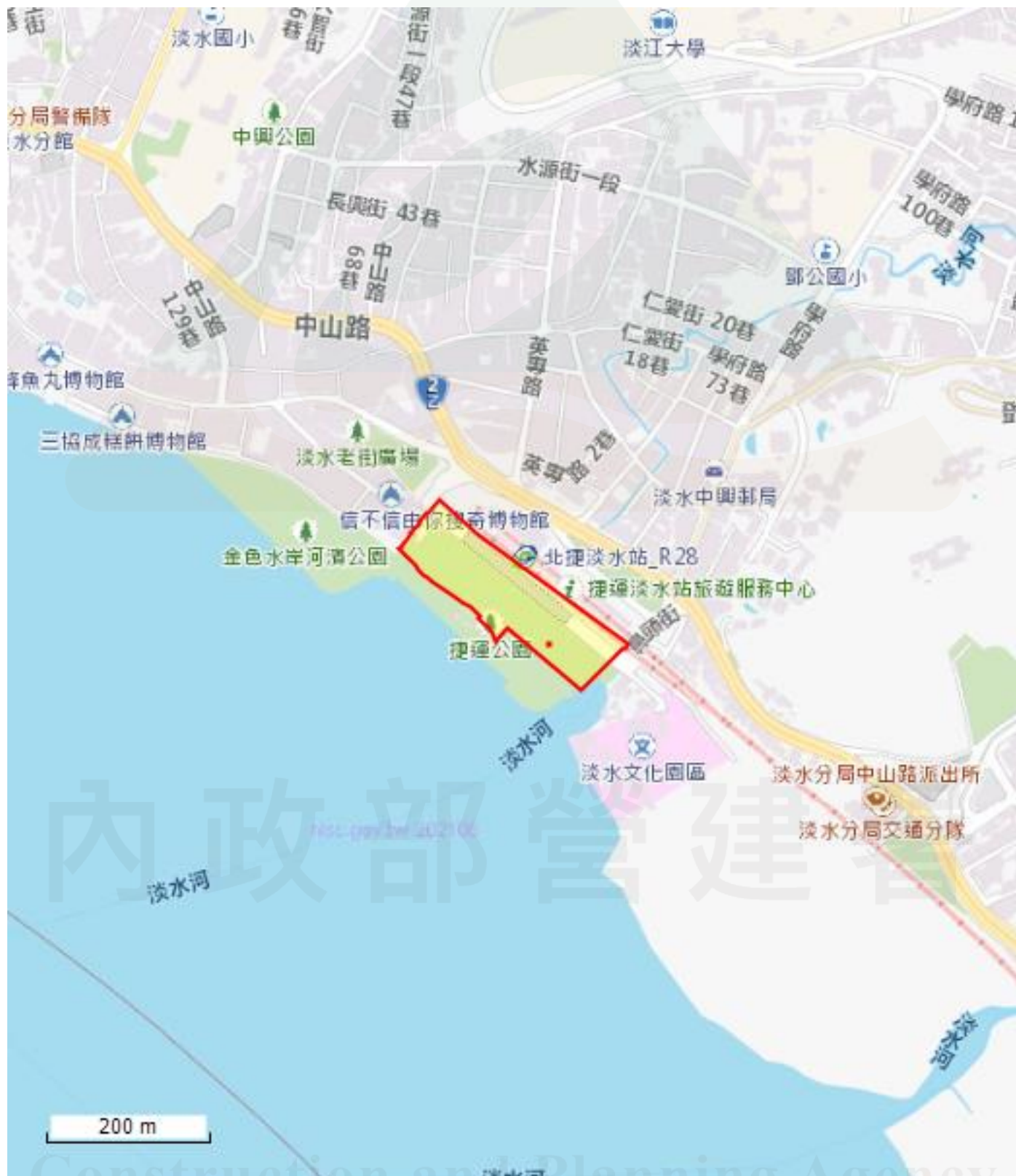
附表1 申請查詢範圍位置圖