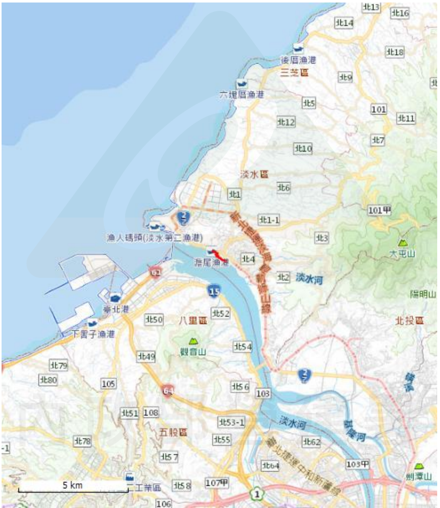
申請案件位置略圖