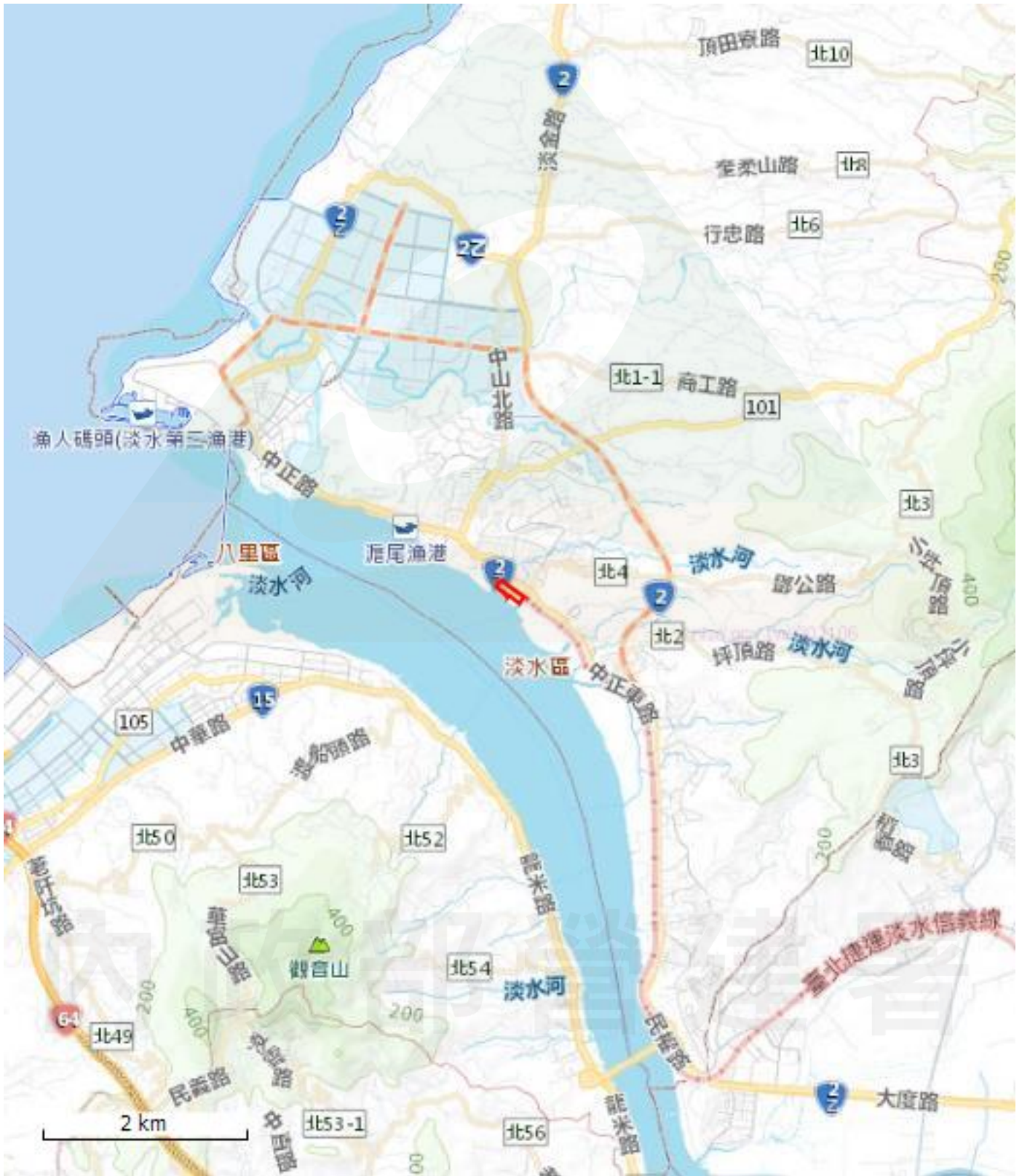
申請案件位置略圖