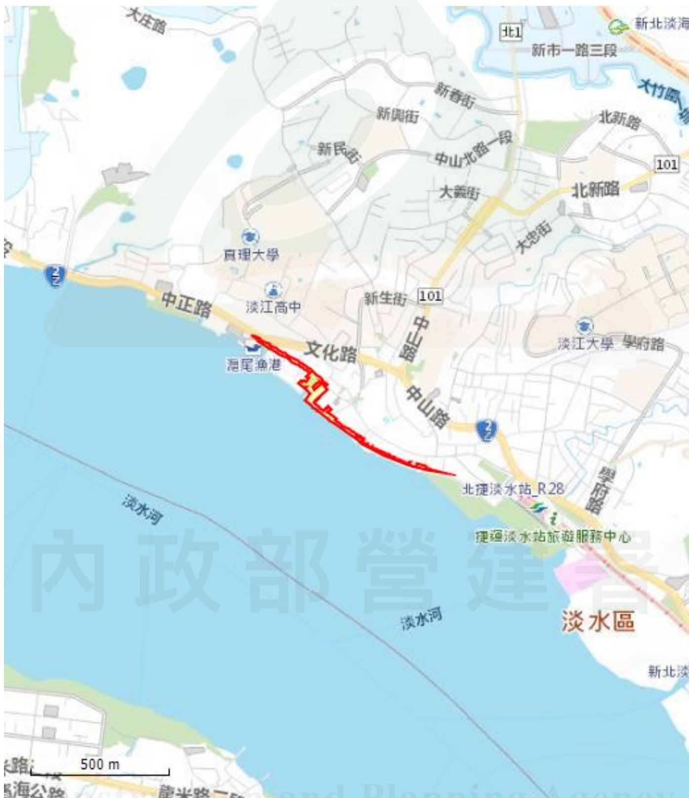
附表1 申請查詢範圍位置圖