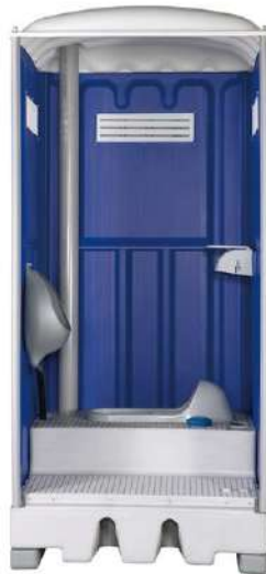
圖四 工地廁所內部