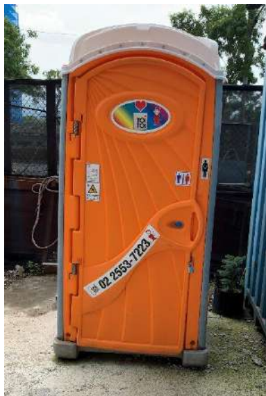
圖五 女性專用工地廁所

其中於 LB08 車站，目前工項多為室內工作，因有多數女性勞工在此工區作業，特別設置 1 座女性專用廁所，如圖三女性專用工地廁所圖，以保障女性勞工如廁環境，並減緩女廁排隊等候情形。