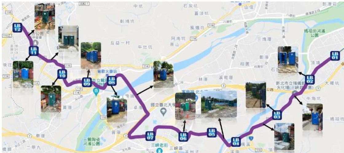
圖三 工地廁所位置