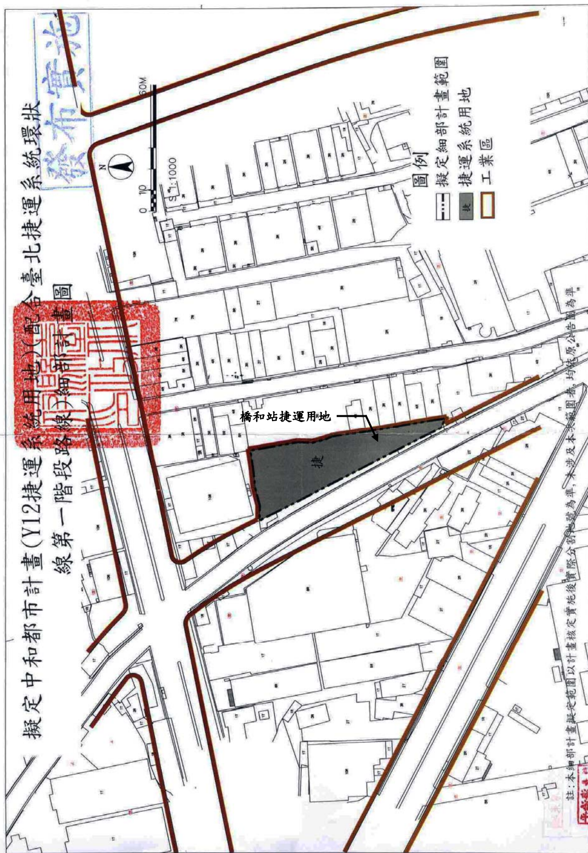
圖一：環狀線第一階段橋和站(Y12)捷運系統用地都市計畫圖