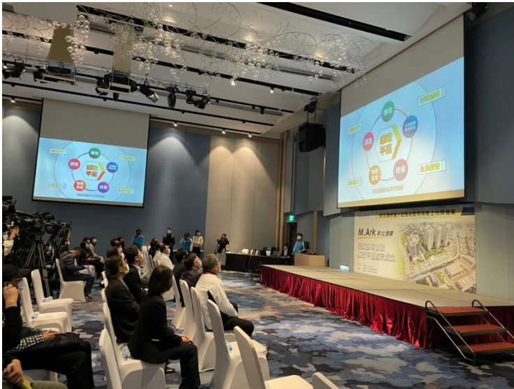
▲長官觀賞招商及廉政平臺介紹影片

藉廉政平臺公私協力之監督機制，確保土地開發資訊公開透明，杜絕外部勢力不當干預，讓公務同仁勇於任事，維護投資人合理權益，使新北捷運環狀線土地開發能「如期、如質、無弊」完成。