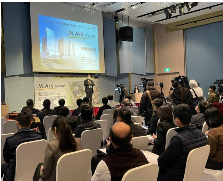
▲法務部廉政署鄭銘謙署長致詞