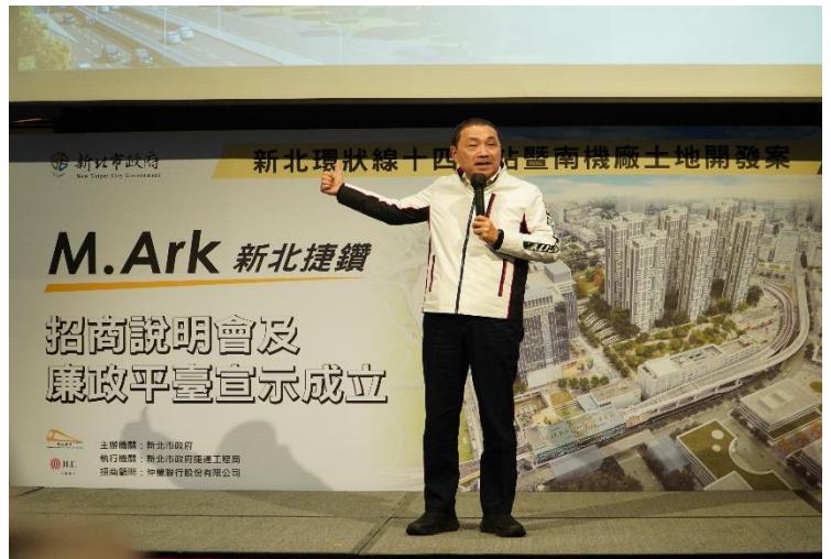
▲新北市政府侯市長致詞