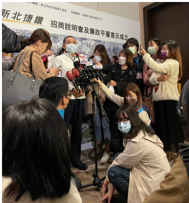
▲新北市政府侯市長接受媒體聯訪