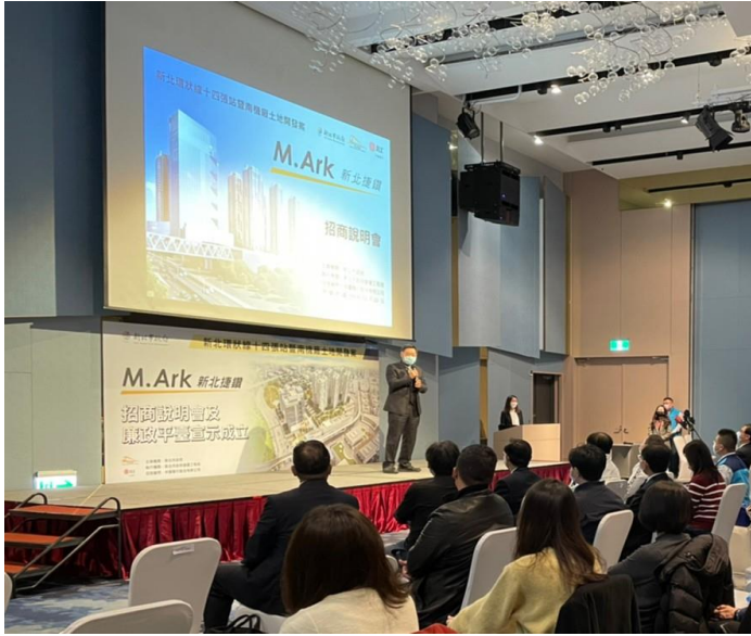
▲臺灣新北地方檢察署徐錫祥檢察長致詞