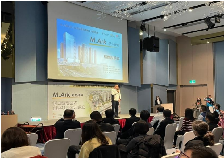
▲新北市政府侯市長致詞