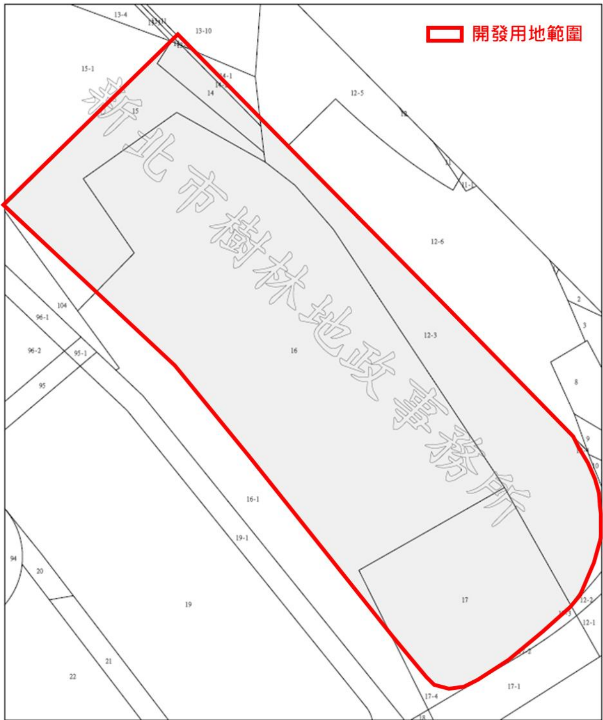
附圖二、三鶯線三峽站出入口 2 捷運開發區地籍圖