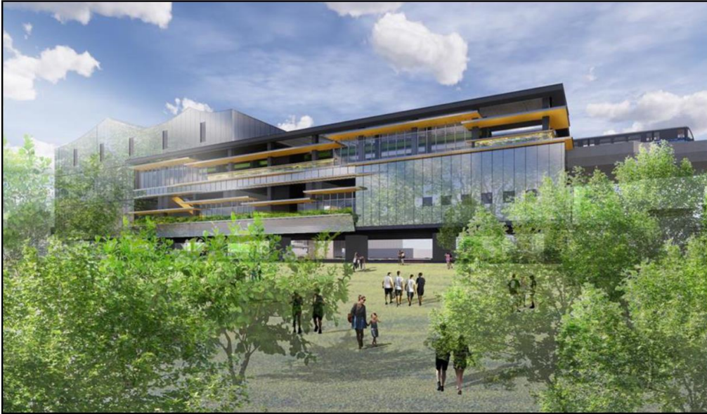
圖6.8.1-1 變更後LG11站電腦景觀模擬示意圖

(出處：110.06 萬大-中和-樹林地區捷運系統環說書第3次環差第二次修正本 p6-66)