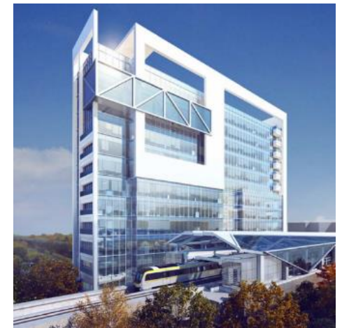
軌道車站周邊開發社會宅示意圖