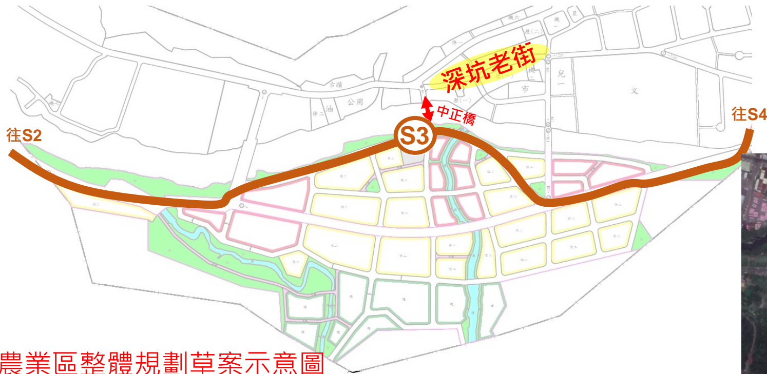
農業區整體規劃草案示意圖