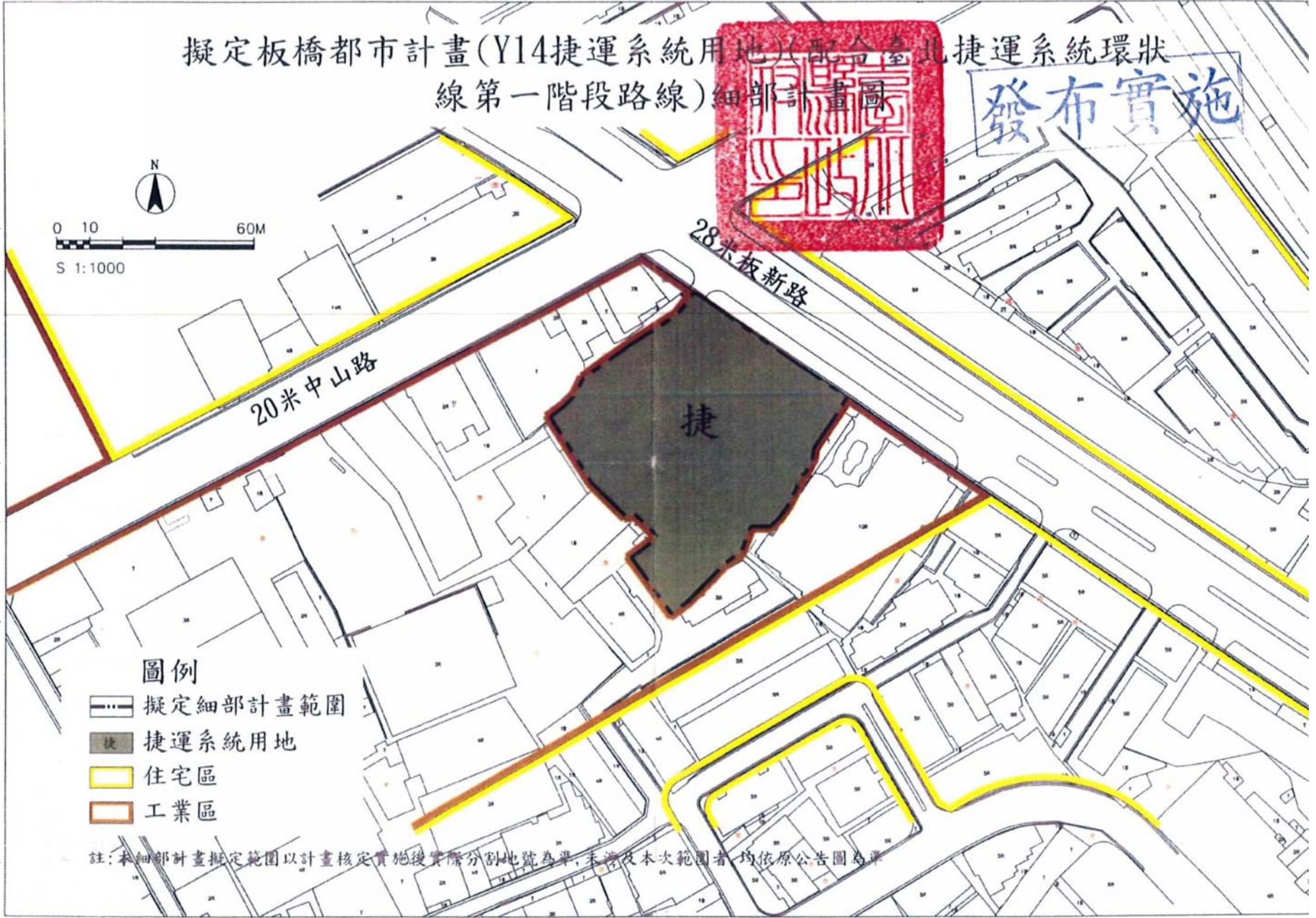
圖一：環狀線第一階段板新站(Y14)捷運系統用地都市計畫圖