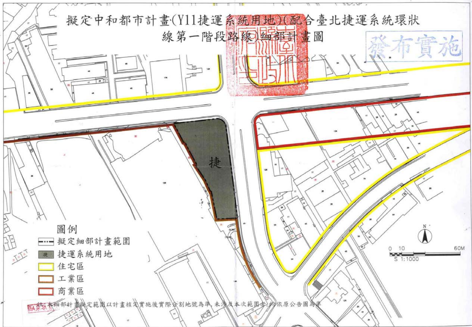
圖一 中和站(Y11)捷運系統用地都市計畫圖